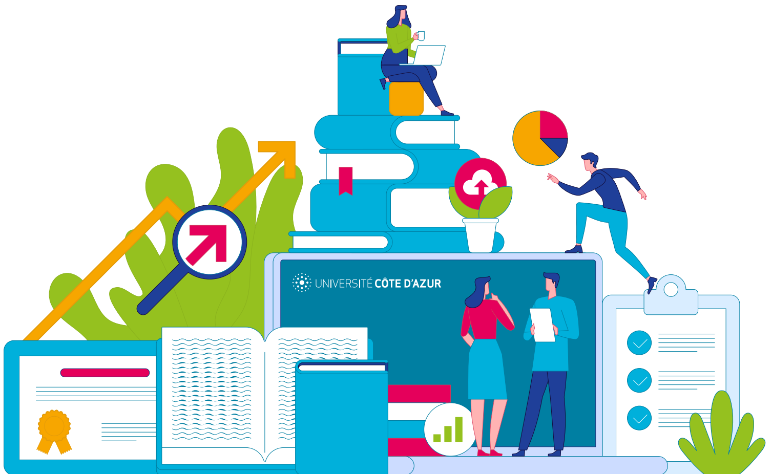
SCHÉMA DIRECTEUR de la Vie Étudiante